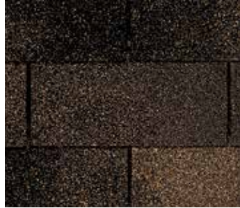
Brezo combinado (Heather Blend)