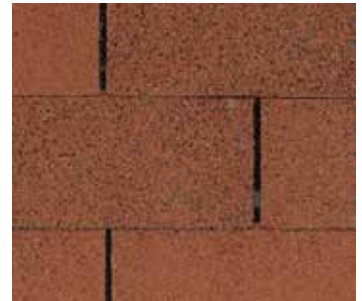
Azulejos rojos combinados (Tile Red Blend)