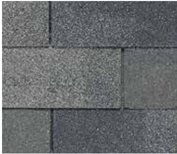
Gris Georgetown (Georgetown Gray)