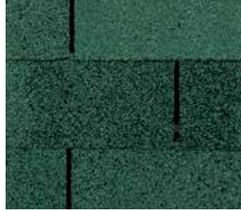
Verde oscuro (Hunter Green)