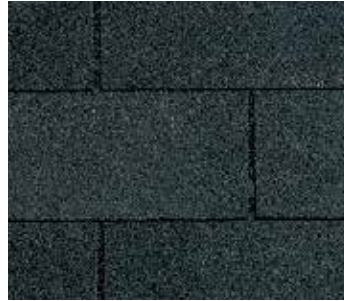
Negro moiré (Moiré Black)