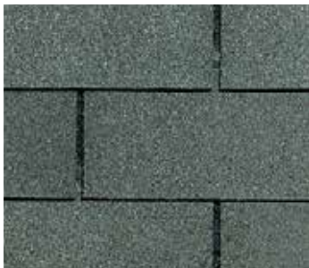
Madera desgastada (Weathered Wood)

NOTA: Debido a las limitaciones en la reproducción de la impresión, CertainTeed no puede garantizar la coincidencia idéntica del color real del producto con las representaciones gráficas que figuran en esta publicación.