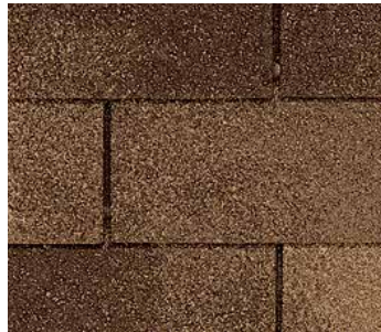
Ripia aserrada (Resawn Shake)