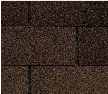
Siena tostado (Burnt Sienna)